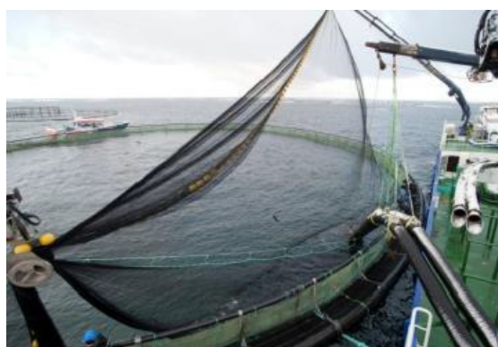
Not blir utstyrt med plast-tag med beskrivelse av lengde dybde

Ved mottak av orkastnot fra Mørenot Aquaculture AS vil produktet være merket med plast tag som beskriver lengde, dybde og produsent av nota.